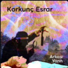
Korkun Esrar Radyo Tiyatrosu