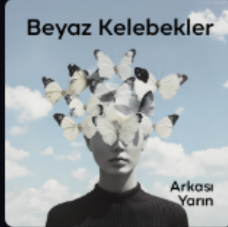
Beyaz Kelebekler Radyo Tiyatrosu