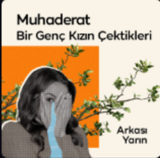
Muhaderat - Bir Gen... Radyo Tiyatrosu